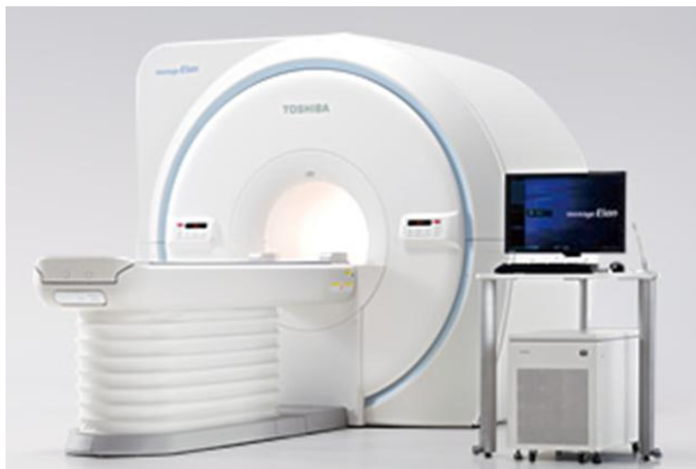
■ 東芝製磁気共鳴画像診断装置